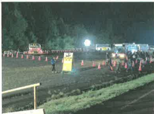
▲ B駐車場（フェス終了後）