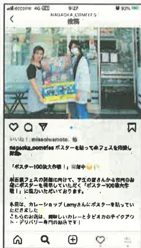
▲インスタグラム ポスター100 俵大作戦！ (学生ボランティア)