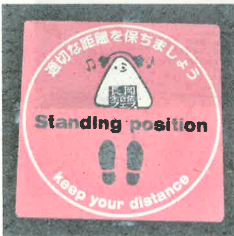
▲スタンディングエリアの立ち位置を示すステッカー