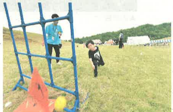
▲軽スポーツアクティビティ