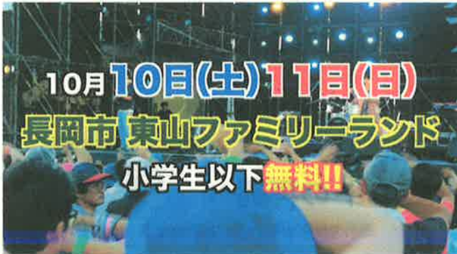
▲PR映像（アオーレ長岡）