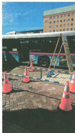
▲長岡駅東口乗り場