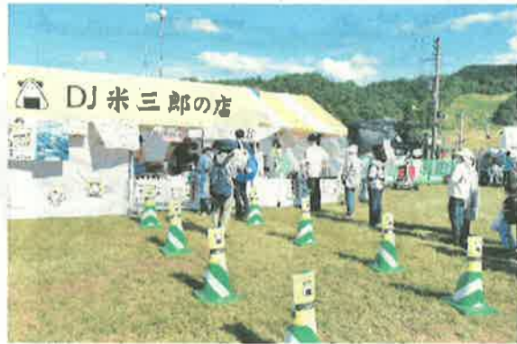
▲間隔をとった待機列