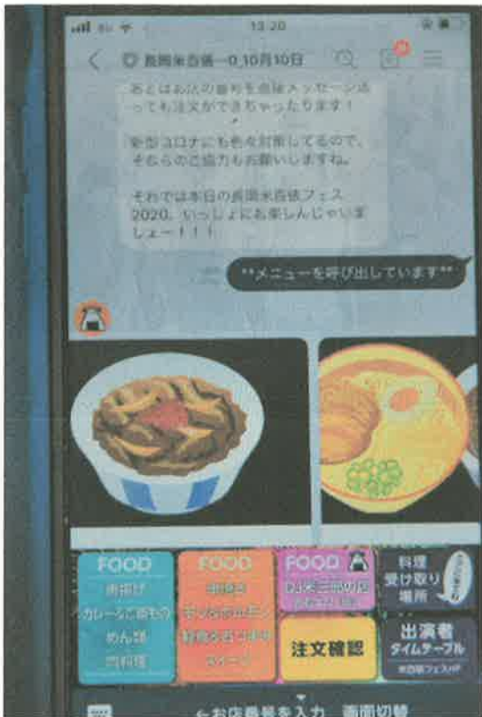
▲LINEアプリの注文画面