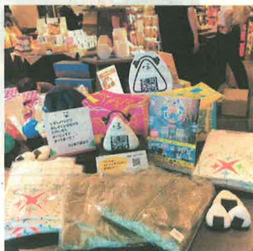
▲グッズ販売（道の駅ながおか花火館）