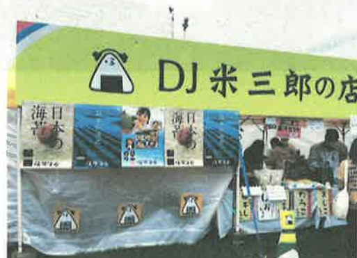
▲ DJ 米三郎の店