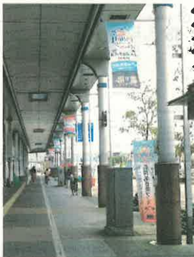
▲のぼり、タペストリー（大手通商店街）