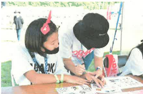
▲親子で楽しむイベント内容