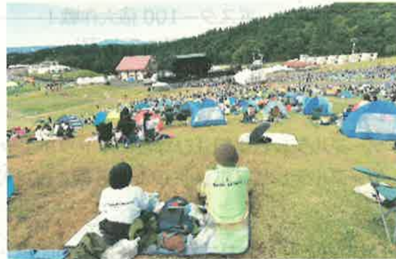
▲シートテントエリア