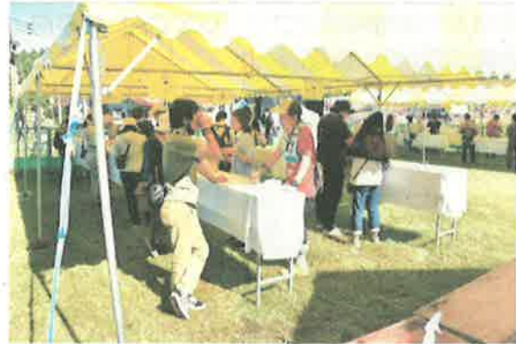
▲飲食場所の利用時間は15分以内