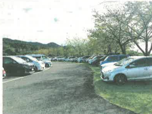
▲会場内駐車場（農業公園）