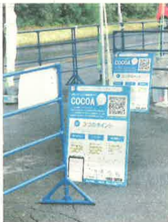
▲インストールを促す看板