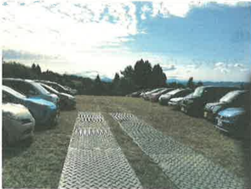
▲会場内駐車場（牧草地）