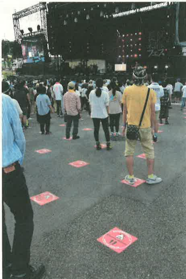
▲スタンディングエリア